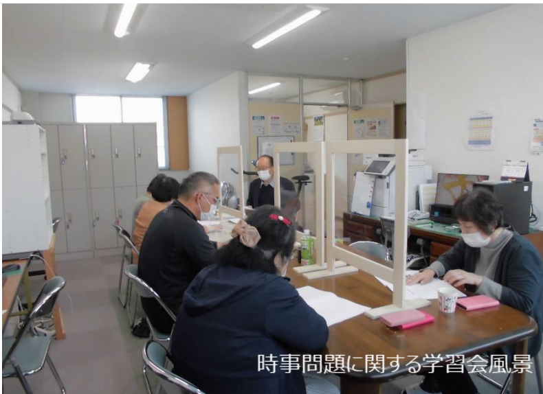
時事問題に関する学習会風景